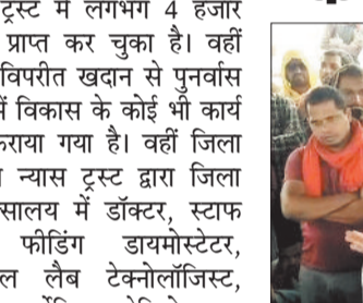
वार्ता के दौरान उपस्थित भूविस्थापित व एसईसीएल के अधिकारी।

हरिभूमि न्यूज || कोरबा कोयला उत्पादन के लिए जमीन को तरसती कुसमुंडा परियोजना में उम्मीद की किरण जगी है, ये उम्मीद की किरण ठेका कंपनी नीलकंठ के अधिकारियों के लगातार प्रयासों से आई है। ज्ञात हो कि बीते कुछ सप्ताह से जमीन नहीं होने की वजह से पाली ग्राम के लगभग 115 ग्रामीणों को बैठा दिया गया था। क्षेत्र के ग्रामीण श्रम सेवा