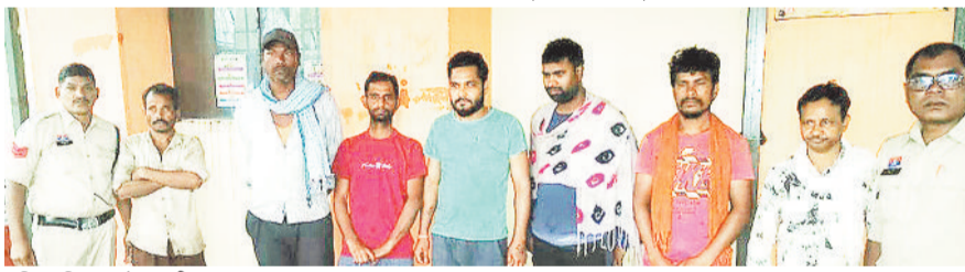
पुलिस गिरफ्त में वारंटी।