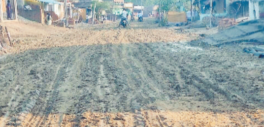
बारिश से कीचड़ से सर्राबोर हुई सड़क।

ग्राम पंचायत मुड़ापार से कोरबी तक 5 किलोमीटर सड़क निर्माण की मांग वर्षों से ग्रामवासियों के द्वारा की जा रही थी। आखिरकार वो पूरी तो हुई लेकिन ठेकेदार की लापरवाही से क्षेत्र के लोग इस मार्ग में आवागमन करने से परेशान हो चले हैं।