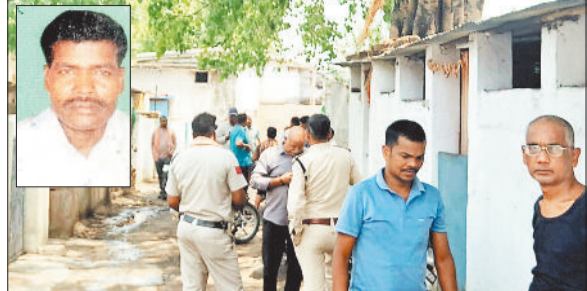
घटनास्थल का मुआयना करती पुलिस एवं इनसेट में मृतक।