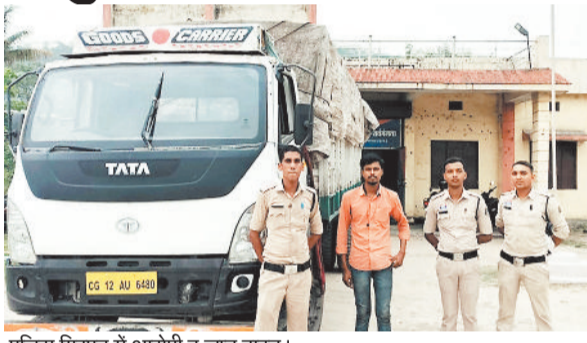
पुलिस गिरफ्त में आरोपी व जप्त वाहन।