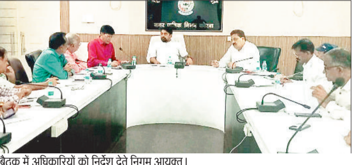
बैठक में अधिकारियों को निर्देश देते निगम आयुक्त।

निगम आयुक्त ने नगर निगम के जोन कमिश्नरों व प्रभारी अधिकारियों की बैठक लेकर सुशासन तिहार के अंतर्गत आमनागरिकों द्वारा विभिन्न मांग व शिकायतों के संबंध में प्रस्तुत किए गए आवेदन पत्रों एवं उनके निराकरण की कार्यप्रगति की समीक्षा की। आवेदनों की जोनवार व विषयवार समीक्षा करते हुए कहा कि सुशासन तिहार के तहत नगर निगम से जुड़े निर्माण व विकास कार्य सड़क, नाली तथा अन्य मरम्मत कार्य, स्ट्रीट लाइट, पेयजल, साफ-सफाई आदि के साथ ही राष्ट्रीय परिवार सहायता, विभिन्न पेंशन योजनाओं, प्रधानमंत्री आवास योजना, भवन निर्माण अनुज्ञा, नामांतरण, राशन कार्ड, श्रम कार्ड, आयुष्मान कार्ड सहित विभिन्न शिकायतों व मांग संबंधी जो आवेदन प्राप्त हुए हैं, उन सभी आवेदनों का संतुष्टिपूर्ण निराकरण