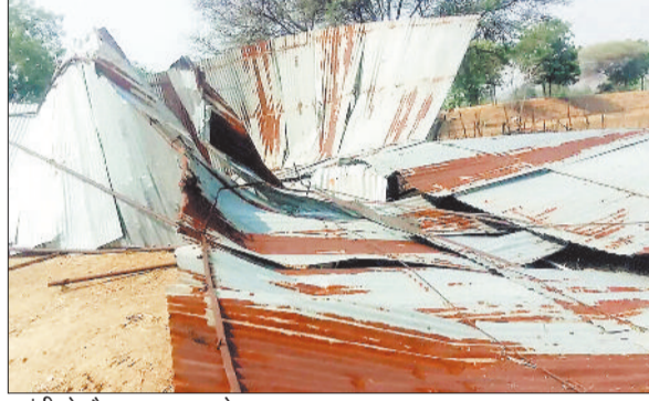
आंधी से गौशाला का उड़ा शेड।

जिले में पिछले दो दिनों से मौसम का मिजाज बिगड़ा हुआ है। सोमवार को तेज आंधी-तूफान के साथ झमाझम बारिश हुई। बिजली कड़की और ओले भी गिरे। शहर की कई बस्तियों में जलभराव की स्थिति बन गई। मंगलवार को भी दोपहर से मौसम में बदलाव शुरू हुआ। काली घटाएं छाईं और शाम होते ही तेज आंधी-तूफान ने दस्तक दी।