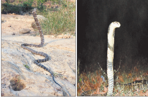
जंगलों में देखा गया पहरचिती।

कुनबे को बढ़ाने के लिए पिछले 1 साल से कोरबा के जंगल में घूम घूम कर विशेषज्ञों की टीम इस पर रिसर्च कर रही थी। रिसर्च अब लगभग पूरी हो चुकी है जिसमें चौकाने वाली जानकारी सामने आई है। बताया जाता है कि कोरबा के जंगल में पहले एक रेंज में ही किंग कोबरा पाया जाता था लेकिन अब करतला रेंज को छोड़ दिया जाए तो बाकी सभी रेंज में किंग कोबरा ने अपनी दस्तक दी है जो वन विभाग के लिए