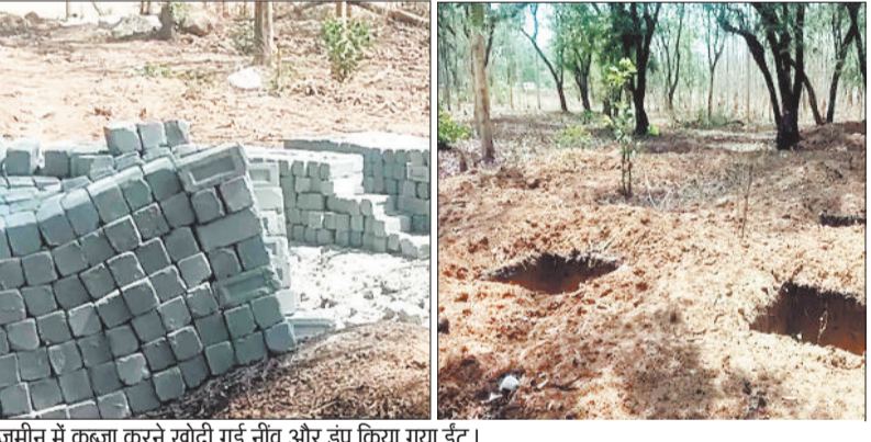
जमीन में कब्जा करने खोदी गई नौव और डंप किया गया ईट।