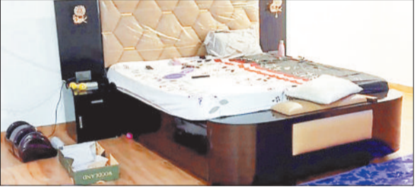
चोरों द्वारा बिखेरा गया सामान।